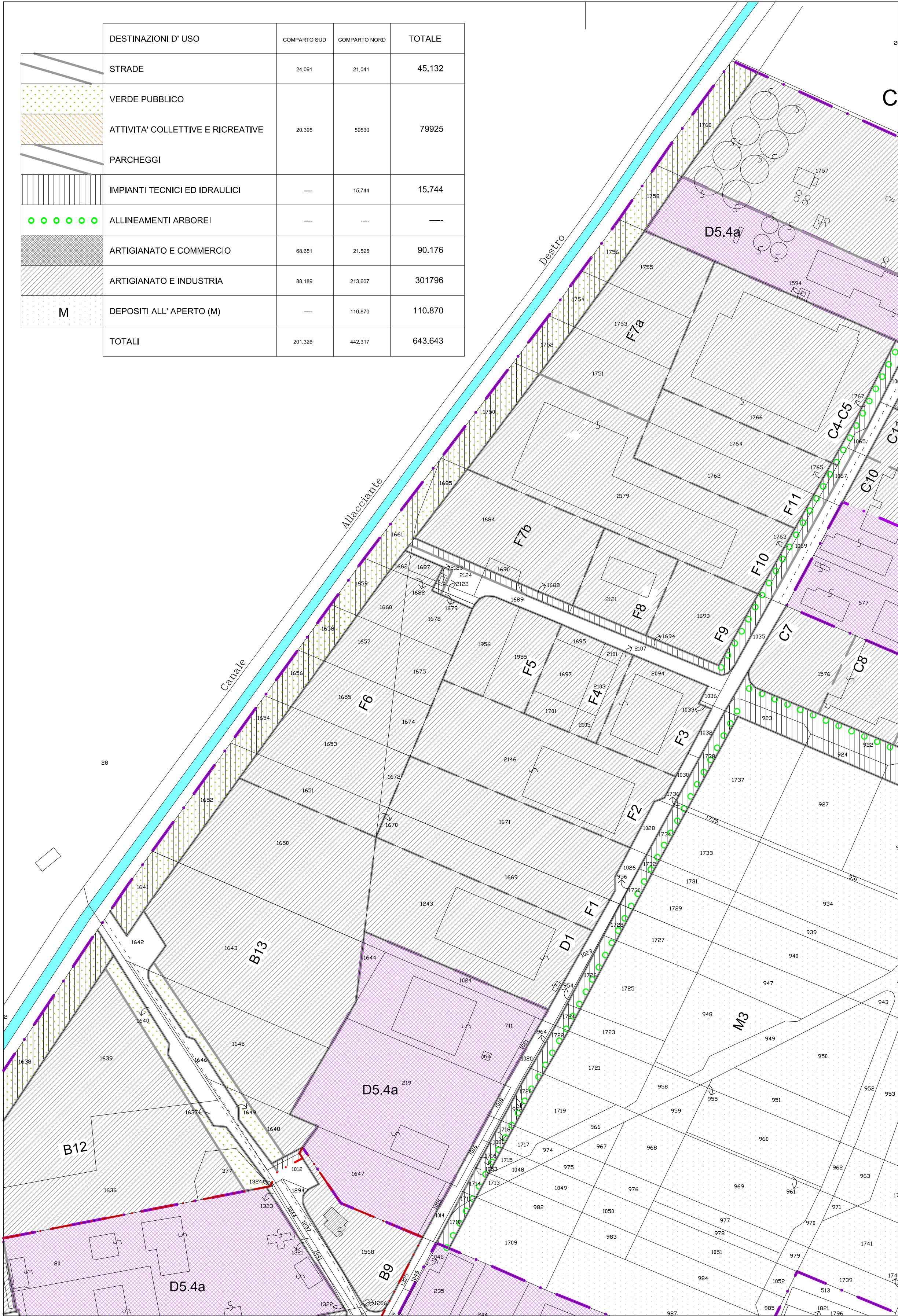
ESTRATTO DELLA VARIANTE DEL P.I.P. DI MONTEGEMOLI VIGENTE 5 - SCHEMA DI LOTTIZZAZIONE E DESTINAZIONI D'USO SCALA 1:2000